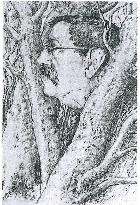
„Selbst im Wald“ heißt diese Arbeit von Günter Grass. Das Bild zeigt das häufig bei ihm auftauchende Motiv des Waldes.